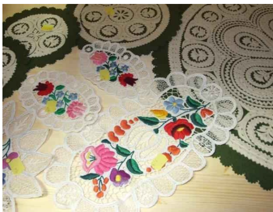
Kalocsai hímzések, filc rávarrásos terítők, alátétek.