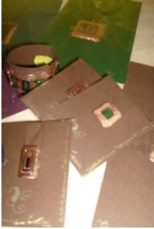
Tűzzománc gyűrűk, medálok, karkötők, szettek.