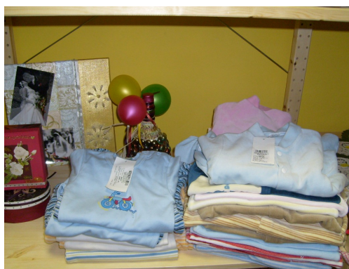
Egyedi díszített üvegek, dobozok, képek.

Új gyermekzoknik, gyermekharisnyák, rugdalódzók, pólók rendkívül kedvezményes áron.